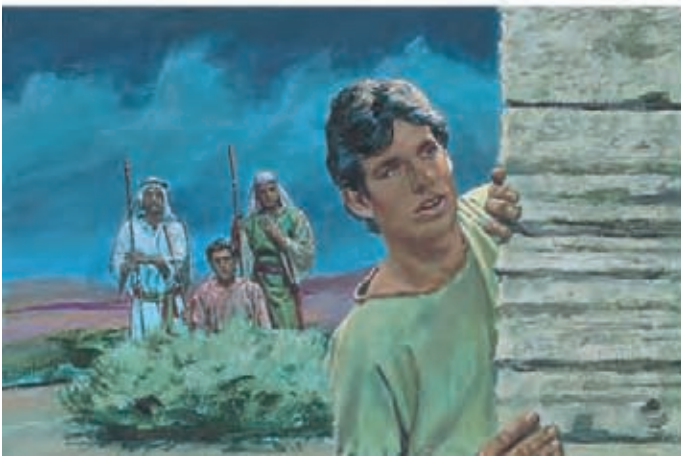
Naquela noite, os irmãos de Néfi ficaram escondidos do lado de fora da muralha enquanto Néfi entrava disfarçadamente na cidade. Ele foi à casa de Labão. 1 Néfi 4:5