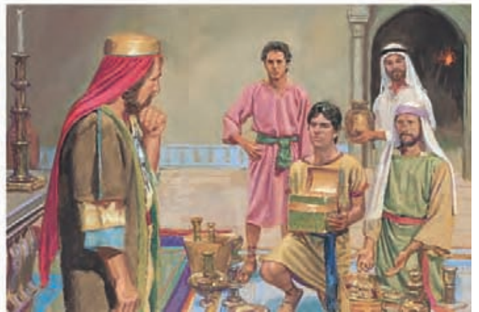
Eles mostraram suas riquezas a Labão e perguntaram se ele queria trocá-las pelas placas de latão. Quando Labão viu o ouro e a prata, tomou tudo para si e expulsou Néfi e seus irmãos. 1 Néfi 3:24-25