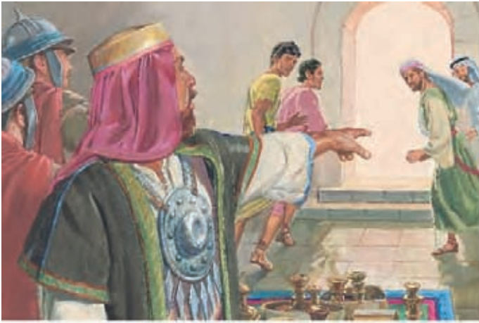
Labão ordenou a seus homens que matassem os filhos de Leí. Néfi e seus irmãos correram e esconderam-se em uma caverna. Labão ficou com o ouro e a prata deles. 1 Néfi 3:25-27