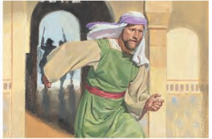
Labão ficou zangado e não quis entregar as placas de latão a Lamã. Labão quis matar Lamã, mas Lamã fugiu. 1 Néfi 3:13-14