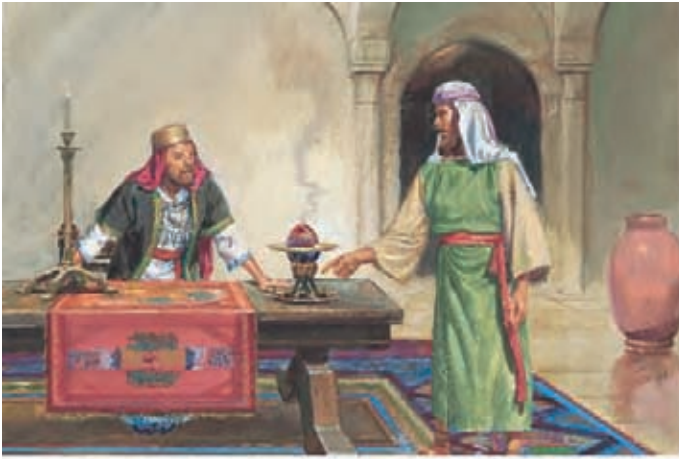
Lamã foi à casa de Labão e pediu-lhe as placas. 1 Néfi 3:11-12