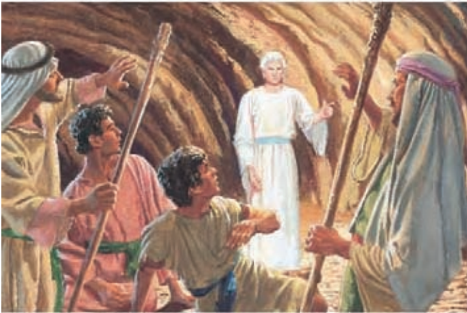
Um anjo apareceu e pediu a Lamã e Lemuel que parassem. O anjo disse a eles que o Senhor os ajudaria a conseguir as placas. Ele também disse que Néfi seria o líder de seus irmãos. 1 Néfi 3:29