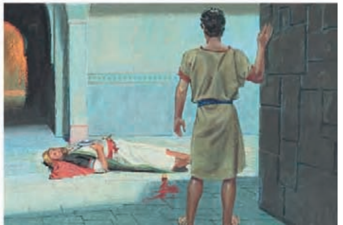
Ao aproximar-se da casa de Labão, Néfi viu um homem bêbado caído no chão. Era Labão. 1 Néfi 4:6-8