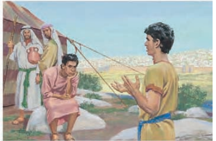
Néfi disse que não voltaria sem as placas de latão. Disse aos irmãos que eles conseguiriam as placas se tivessem mais fé no Senhor. 1 Néfi 3:15-16