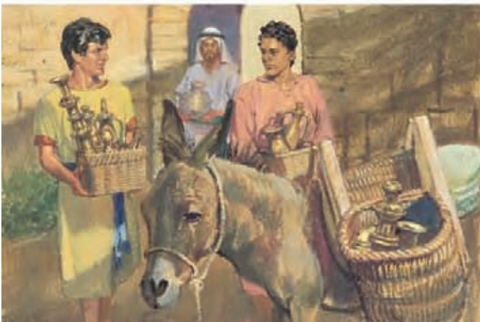
Néfi e seus irmãos voltaram à sua antiga casa em Jerusalém. Pegaram o ouro e a prata que tinham para trocar pelas placas. 1 Néfi 3:22