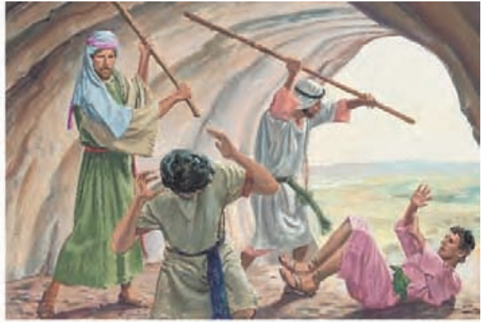
Lamã e Lemuel ficaram zangados com Néfi. Bateram em Néfi e Sam com uma vara. 1 Néfi 3:28