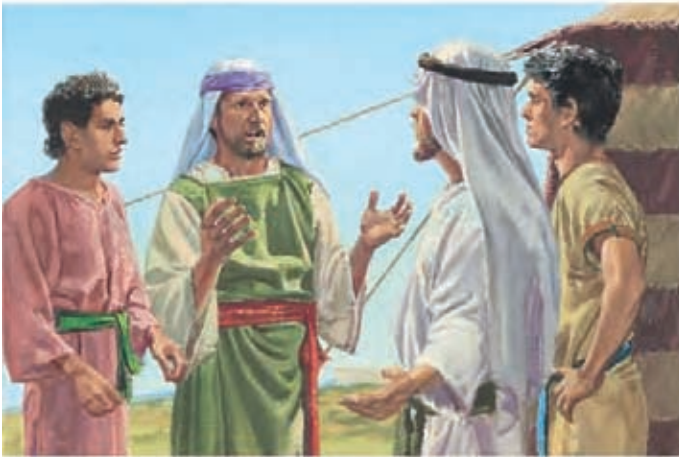
Lamã contou a seus irmãos o que havia acontecido. Ele estava com medo. Queria desistir e voltar para junto de seu pai no deserto. 1 Néfi 3:14