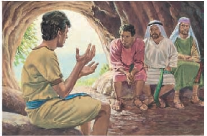
Néfi pediu a seus irmãos que tivessem fé no Senhor e que não tivessem medo de Labão e de seus homens. Néfi incentivou-os a voltar a Jerusalém. 1 Néfi 4:1-4