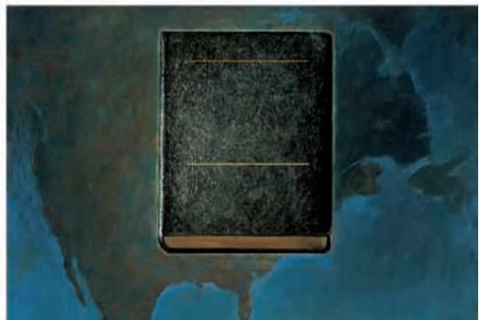
O livro foi chamado de o Livro de Mórmon. Ele conta a história de um povo que viveu nas Américas há muito tempo. Fala também a respeito de Jesus Cristo, o Filho de Deus. Introdução do Livro de Mórmon