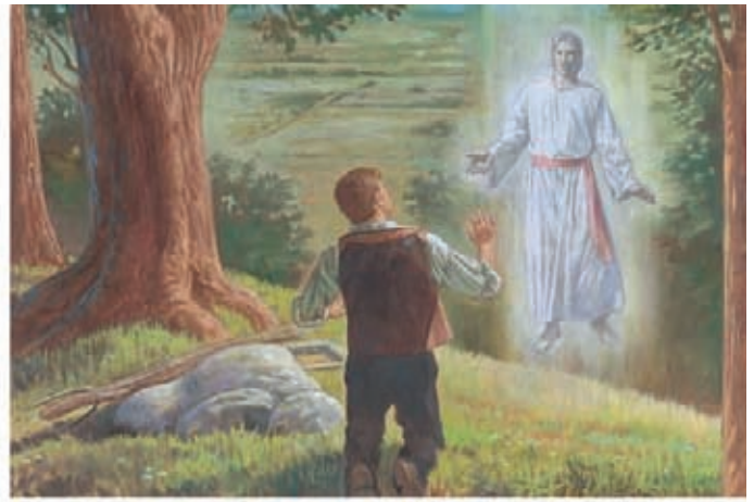
Morôni apareceu e disse a Joseph que não levasse as placas, mas que voltasse naquela mesma data durante os próximos quatro anos. Joseph recebia instruções do anjo Morôni todas as vezes que voltava àquele lugar. Joseph Smith— História 1:53–54