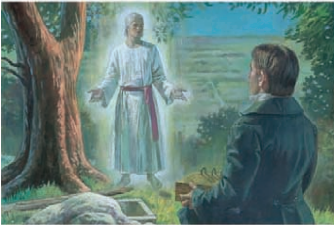
Depois de quatro anos, Joseph pôde finalmente levar as placas de ouro. Ele utilizou o Urim e o Tumim para traduzir parte delas. Joseph Smith— História 1:59, 62