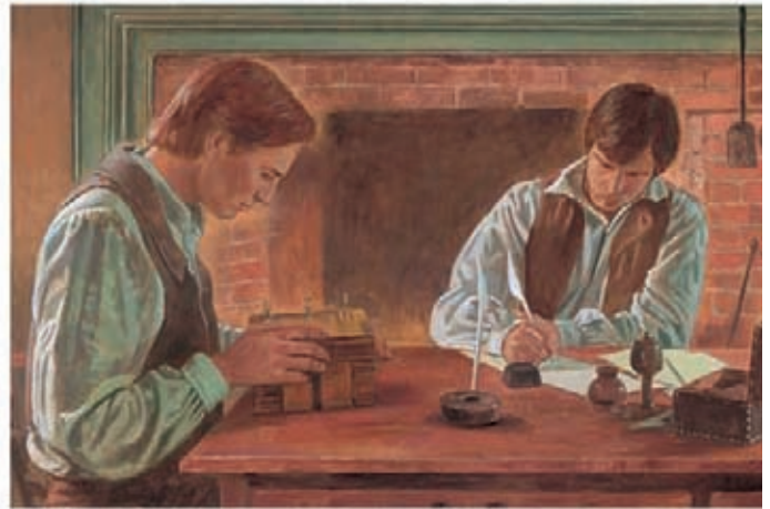
Joseph contou com a ajuda de escribas. Eles escreviam o que ele ditava ao traduzir. Joseph Smith— História 1:67