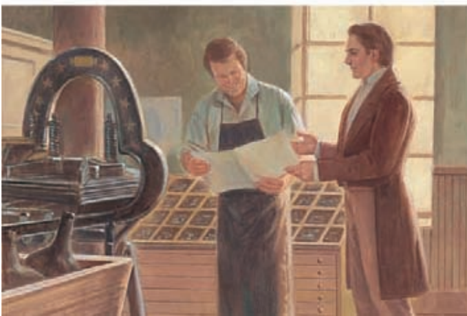
Joseph levou a tradução a um tipógrafo que a transformou em um livro. History of the Church 1:71