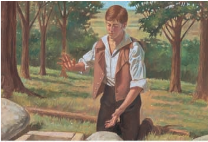
Embaixo da rocha, havia uma caixa feita de pedra. Joseph olhou dentro da caixa e viu as placas de ouro. Joseph Smith— História 1:51–52