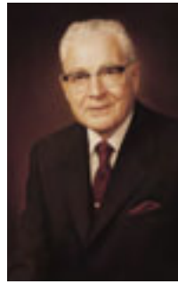
ハロルド・B・リー