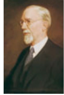
ジョージ・アルバート・スミス