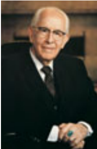
エズラ・タフト・ベンソン