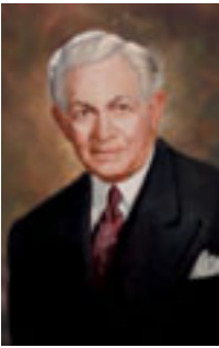
デビッド・O・マッケイ