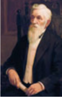
ロレンゾ・スノー