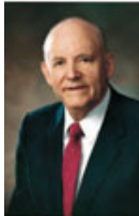
ハワード・W・ハンター