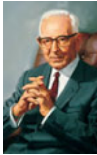
ジョセフ・フィール ディング・スミス