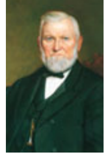
ウィルフォード・ウッドラフ