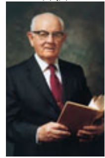
スペンサー・W・ キンボール