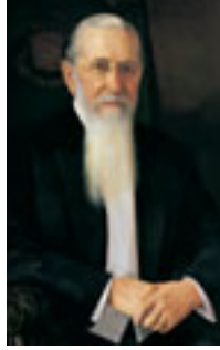
ジョセフ・F・スミス