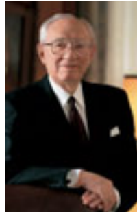
ゴードン・B・ヒンクレイ