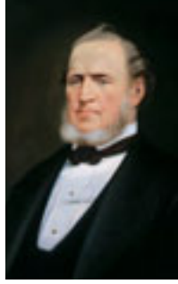
ブリガム・ヤング