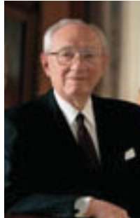
Gordon B. Hinckley