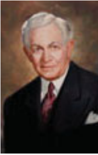
David O. McKay