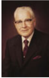
Harold B. Lee