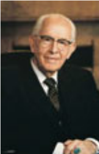
Ezra Taft Benson