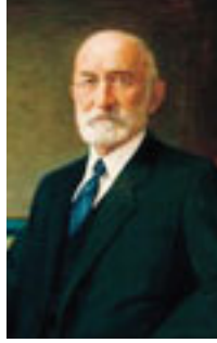
Heber J. Grant