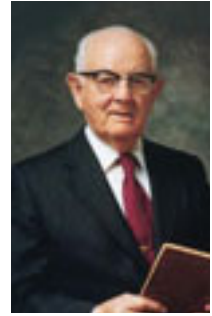
Spencer W. Kimball