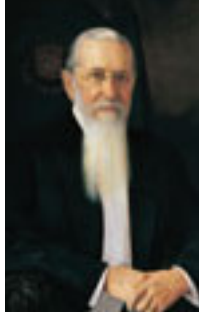
Joseph F. Smith