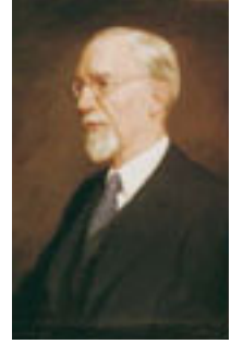
George Albert Smith