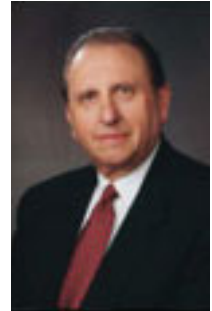
Thomas S. Monson