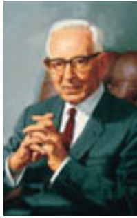
Joseph Fielding Smith