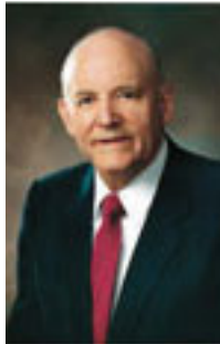
Howard W. Hunter