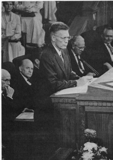
十二使徒議會參摩基布司長老。