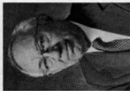
奧格萊文登會長 第二副會長