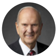
ประธานเนลสัน

ข้าพเจ้าขอเล่าประสบการณ์ในปี 1979 สมัย นั้นข้าพเจ้ากำลังรับใช้เป็นประจำสามัญ โรงเรียนวันอาทิตย์ ข้าพเจ้าได้รับเชิญให้เข้า ร่วมการประชุมของผู้นำศาสนจักรซึ่งประธาน ศาสนจักร ประธานสเปนเซอร์ ดับเบิลยู. คิมบัลล์เป็นผู้พูด ท่านสั่งให้เราสวดอ้อนวอนว่า ประตูแห่งประชาชาติทั้งหลายจะเปิด ทั้งนี้เพื่อ