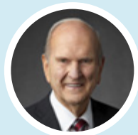
President Russell M. Nelson

DU KAN SELV LÆRE – AKKURAT NÅ I DIN ALDER – HVORDAN DU KAN MOTTA PERSONLIG ÅPENBARING. OG INGENTING VIL UTGJØRE EN STØRRE FORSKJELL I LIVET DITT ENN DET!