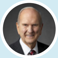
President Russell M. Nelson