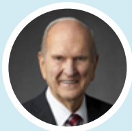
Presidentti Russell M. Nelson

VOITTE SAADA TIETÄÄ ITSE – JUURI NYT TEIDÄN IÄSSÄNNE – KUINKA VASTAANOTTAA HENKILÖKOH- TAISTA ILMOITUSTA. EIKÄ MILLÄÄN MUULLA OLE SUUREMPAA VAIKUTUSTA ELÄMÄÄNNE!