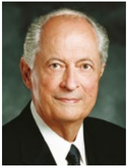
โดย เอ็ลเคอร์ โรเบิร์ต คี. เฮลส์ แห่งไควรัมอัครสาวกสิบสอง