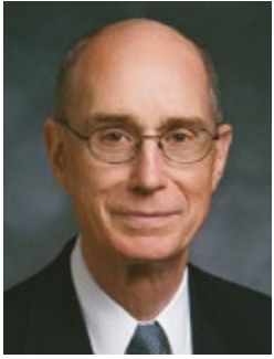
โดย ประธานเฮนรี่ บี. อายริงก์ ที่ปรึกษาที่หนึ่งในฝ่ายประธานสูงสุด