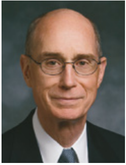
Ni Pangulong Henry B. Eyring Unang Tagapayo sa Unang Panguluhan