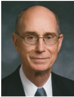
Na te presideni Henry B. Eyring Tauturu Matamua i roto i te Peresideniraa Matamua