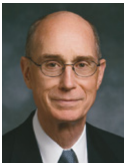
President Henry B. Eyring förste rådgivare i första presidentskapet