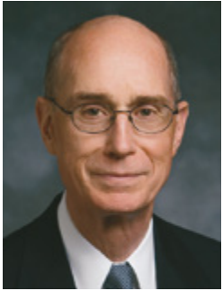
Av president Henry B. Eyring Førsterådgiver i Det første presidentskap