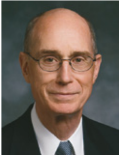
Նախագահ Հենրի Բ. Այրինգ Առաջին Նախագահության Առաջին Խորհրդական