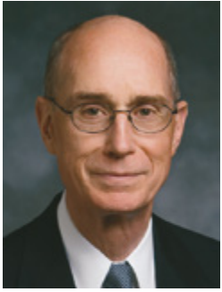
Henry B. Eyring elnök első tanácsos az Első Elnökségben