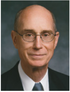
Presidentti Henry B. Eyring

ensimmäinen neuvonantaja ensimmäisessä presidenttikunnassa