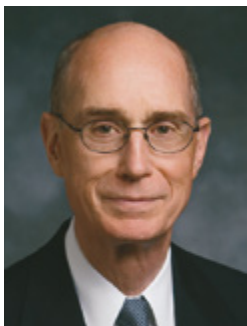
Præsident Henry B. Eyring Førsterådgiver i Det Første Præsidentskab