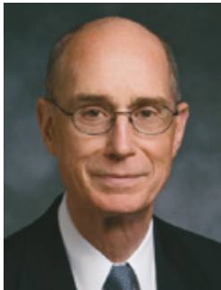
President Henry B. Eyring První rádce v Prvním předsednictvu