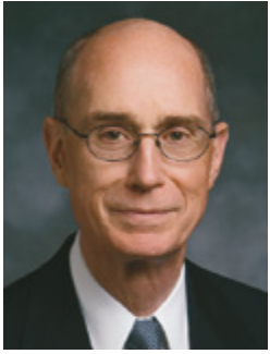
Ni Presidente Henry B. Eyring Unang Magtatambag sa Unang Kapangulohan