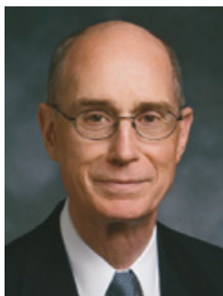
President Henry B. Eyring