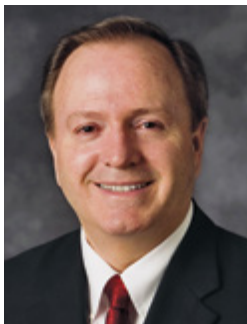
Na Elder Lynn G. Robbins No te peresideniraa o te Hitu Ahuru