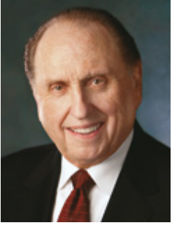
Na te peresideni Thomas S. Monson