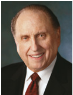
Thomas S. Monson elnök