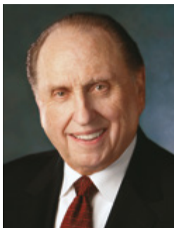
Præsident Thomas S. Monson