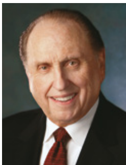
President Thomas S. Monson