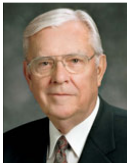
Äldste M. Russell Ballard i de tolv apostlarnas kворum