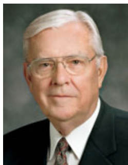
Старейшина М. Рассел Баллард Член Кворума Двенадцати Апостолов