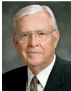
Vanhin M. Russell Ballard kahdentoista apostolin koorumista