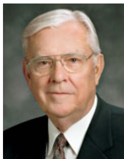
Starší M. Russell Ballard Kvorum Dvanácti apoštolů