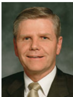
Старейшина Мервин Б. Арнольд Член Кворума Семидесяти