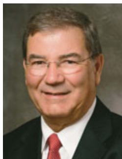
Старейшина Жаиро Мазагарди Член Кворума Семидесяти