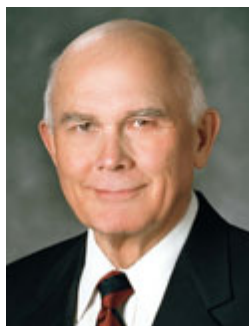
Старейшина Даллин Х. Оукс Член Кворума Двенадцати Апостолов