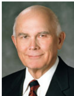
Av eldste Dallin H. Oaks i De tolv apostlers quorum