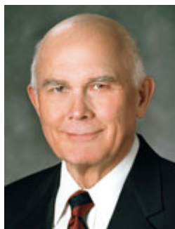
Ouderling Dallin H. Oaks van het Quorum der Twaalf Apostelen