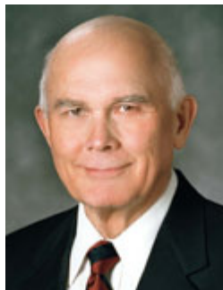
Írta: Dallin H. Oaks elder a Tizenkét Apostol Kvórumából