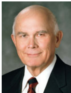
Eldste Dallin H. Oaks De Tolv Apostles Kvorum