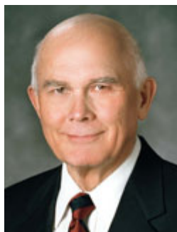
Starší Dallin H. Oaks Kvorum Dvanácti apoštolů