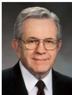
Av president Boyd K. Packer President for De tolv apostlers quorum