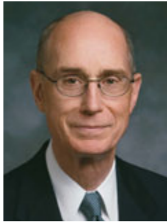
President Henry B. Eyring