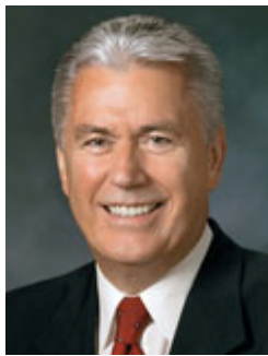
President Dieter F. Uchtdorf

Tweede raadgever in het Eerste Presidium