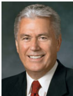
President Dieter F. Uchtdorf