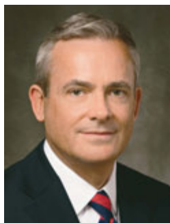
Írta: Patrick Kearon elder a Hetvenektől