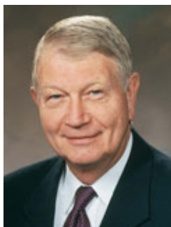
Епископ Ричард К. Эджли

Первый советник в Председательствующем Епископстве