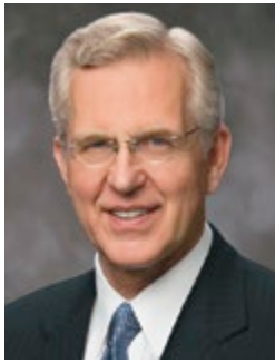
Ni Elder D. Todd Christofferson Ng Korum ng Labindalawang Apostol