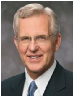
Saunia e Elder D. Todd Christofferson ○ Le Korama a Aposetolo e Toasefululua