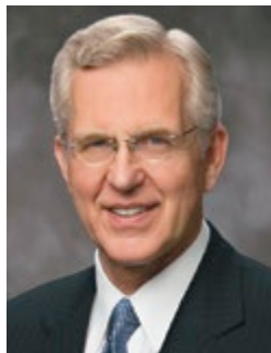
Vârșnicul D. Todd Christofferson din Cvorumul celor Doisprezece Apostoli