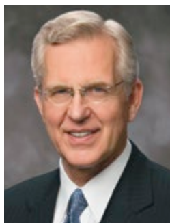
Av eldste D. Todd Christofferson i De tolv apostilers quorum