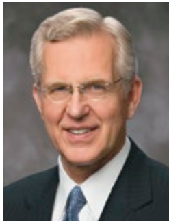
Vanhin D. Todd Christofferson kahdentoista apostolin koorumista